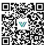
文康法律观察公众号